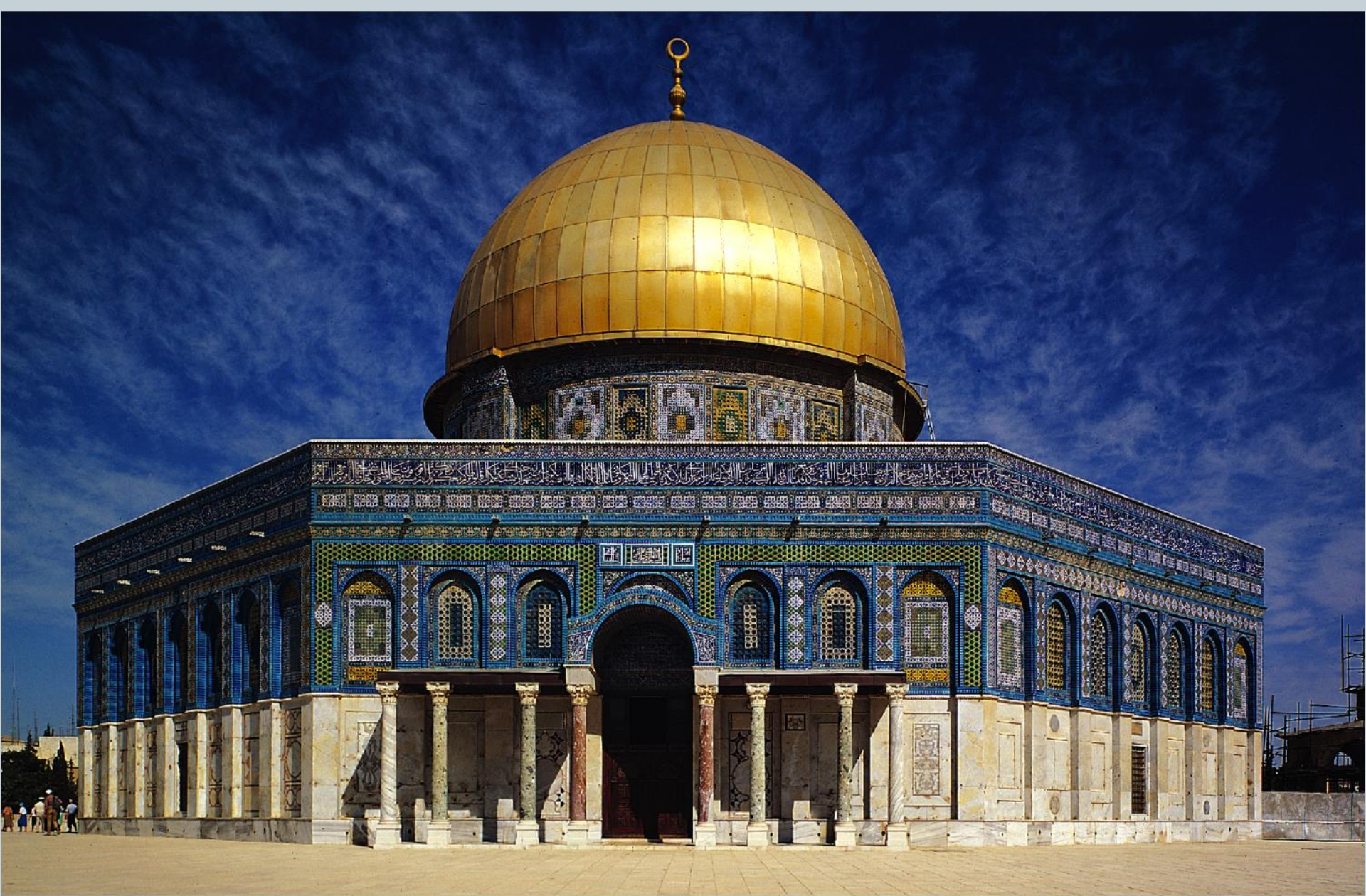
КУПОЛА НА СТЕНИ - ОМАРОВА ЦАМИЈА, ЈЕРУСАЛИМ, 685-691. (МЕСТО МУХАМЕДОВОГ ВАЗНЕСЕЊА)