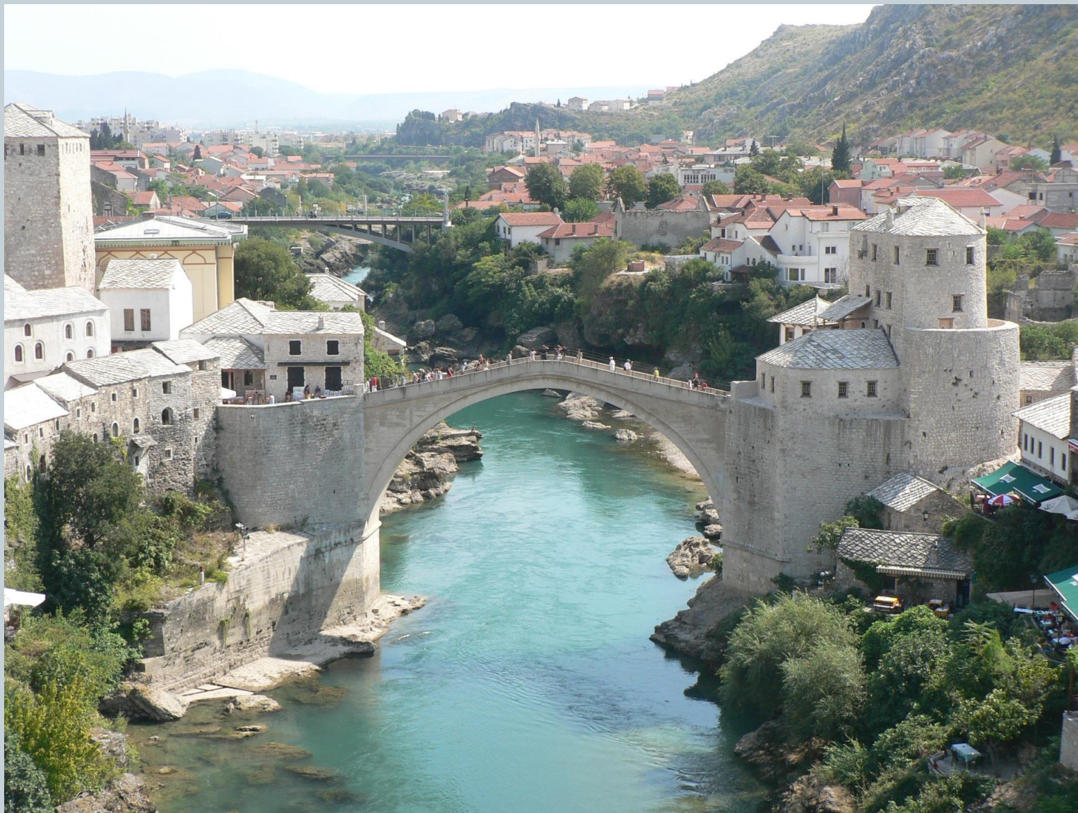
СТАРИ МОСТ У МОСТАРУ, 1566. ГОДИНА