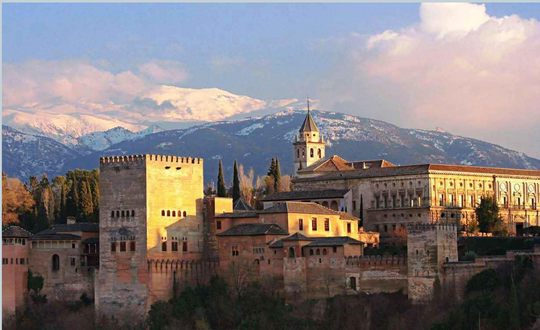
ЦРВЕНА ТВРЂАВА – ДВОРАЦ АЛХАМБРА, XIII-XIV ВЕК, ГРАНАДА