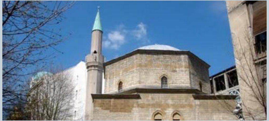
БАЈРАКЛИ ЦАМИЈА, ГОСПОДАР ЈЕВРЕМОВА 11, БЕОГРАД, 1660-1688.