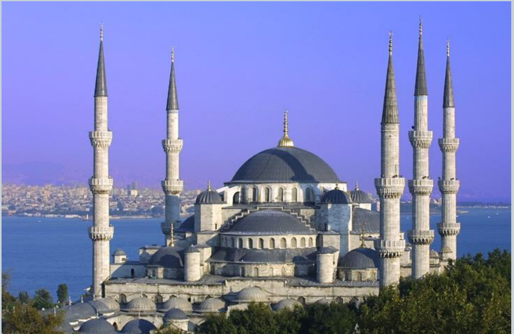
ПЛАВА ЦАМИЈА (ЦАМИЈА АХМЕДА I), ИСТАНБУЛ, ДОВРШЕНА 1616.