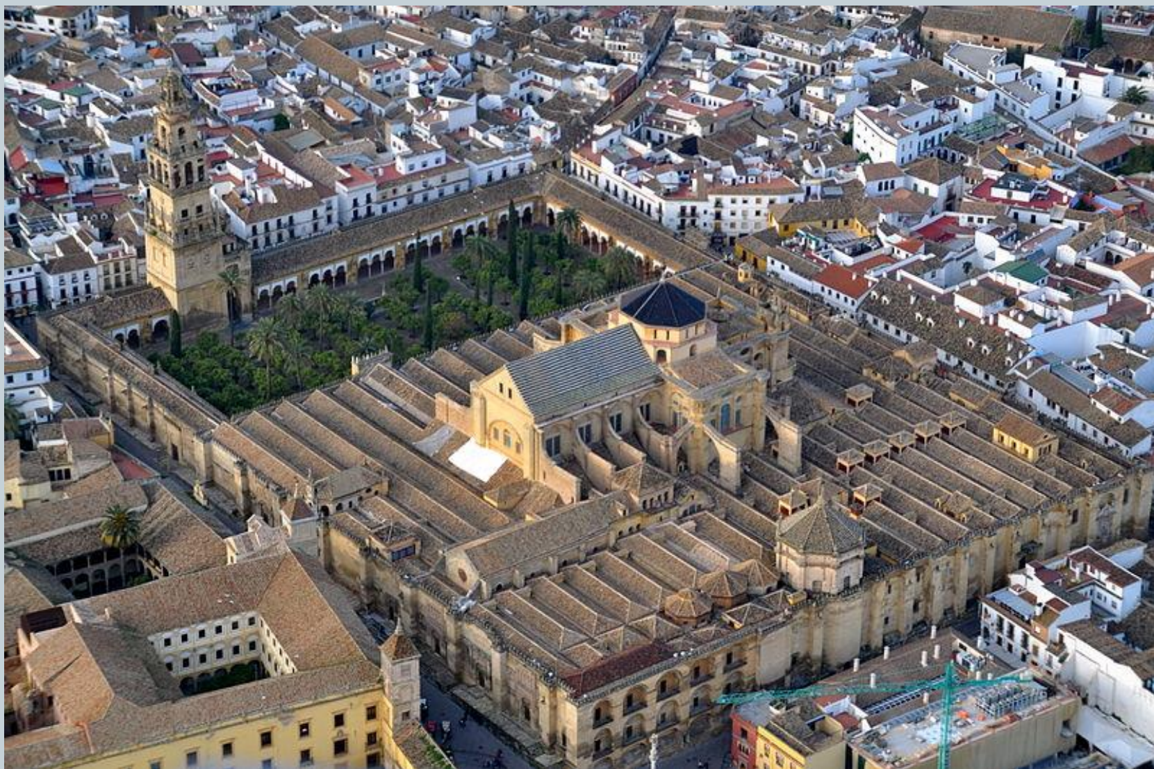
ВЕЛИКА ЦАМИЈА – КАТЕДРАЛА У КОРДОВИ